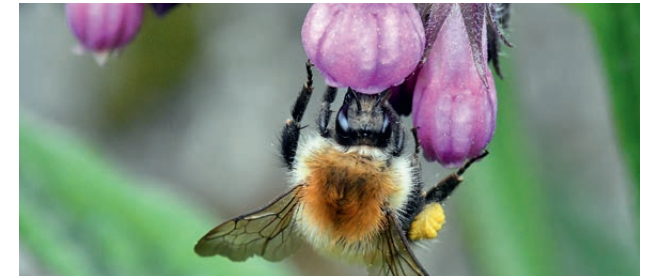
Ackerhummele am Beinwell

Ihr Blütenbau ist extrem unterschiedlich. Bsp.: (Knoten-)Beinwell*, Borretsch, Büschelschön, Lungenkraut, Mönchskraut, Natternkopf*, Ochsenzunge*, (Kleine) Wachsblume*