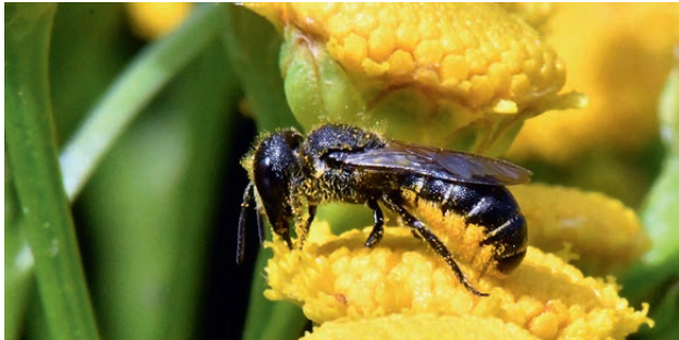
Gemeine Löcherbiene auf Rainfarn

Bsp.: Alant, Bitterkraut*, Disteln, Doldiges Habichtskraut*, Durchwachsene Silphie, Echte Kamille, Färberkamille*, Ferkelkraut*, Flockenblume, Goldrute, Großes Flohkraut*, Habichtskraut, Huf-lattich, Herbst-Aster, Jakobs-Greiskraut*, Klette, Kornblume*, Löwenzahn*, Pippau*, Rainfarn*, Ringelblume, Schafgarbe, Wasserdost*, Weg-warte*, Weidenblättriges Ochsenauge*, Wiesen-Floekenblume*