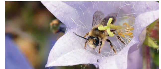
Glockenblumen-Sägehornbiene auf einer Glockenblume

Bsp.: Berg-Sandrapunzel*, Pfirsichblättrige Glockenblume*, Rapunzel-Glockenblume*, Nesselblättrige Glockenblume*, Rundblättrige Glockenblume*, Sibirische Glockenblume*, Wiesen-Glockenblume*