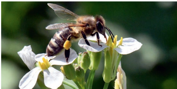
Honigbiene auf Rettich

Bsp.: Acker-Senf*, Berg-Steinkraut*, Blaukissen, Echtes Barbarakraut*, Gänsekresse, Gemüsekohl, Hederich*, Hirtentäschel, Knoblauchsrauke, Raps*, Rauken, Rucola, Schöterich, Senf, Wiesen-Schaumkraut*