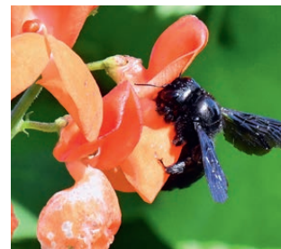
Blauschwarze Holzbiene auf Feuerbohne

Weierhofer Hauptstr. 23 90513 Zirndorf www.lvbi.de/wildbienen wildbienen@lvbi.de