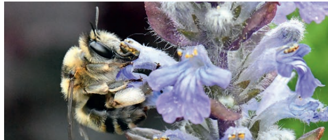
Streifen-Pelzbiene auf Günsel

Bsp.: Dost, Gamander*, Taubnessel*, Gundermann, Günsel, Herzgespann, Lavendel, Katzenminze, Salbei, Schwarznessel*, Steinquendel, Thymian, Wald-Ziest*, Ysop, Zieste