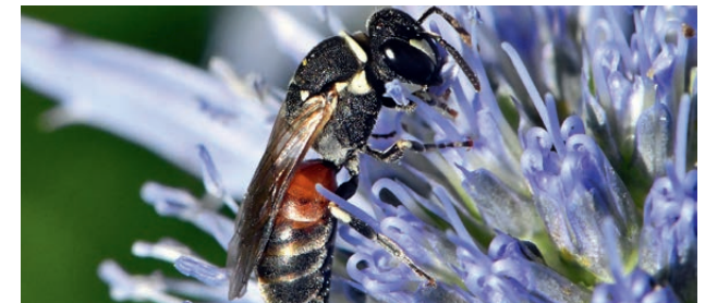
Rote Maskenbiene auf Mannstreu

Bsp.: Fenchel, Giersch*, Hirsch-Haarstrang*, Kerbel, Koriander, Kümmel, Feld-Mannstreu*, Pastinak, Petersilie, Schierling, Wald-Engelwurz*, Wiesen-Bärenklau*, Wilde Möhre*.