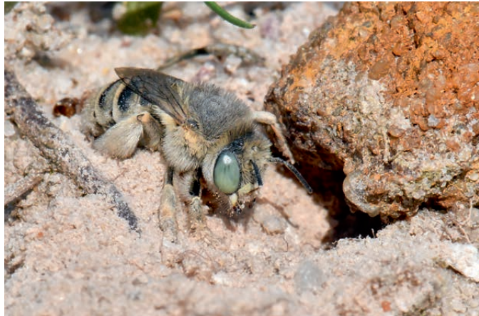
Dünen-Pelzbienen sind relativ stark behaart

Wespen besitzen dieselben Merkmale, jedoch keinen Rüssel. (Sie besitzen Beißwerkzeuge, da sie ihre Brut ausschließlich mit tierischem Eiweiß ernähren). Außerdem haben die meisten Wildbienen eine mehr oder weniger starke Behaarung, die sich mit zunehmendem Alter abnutzt.