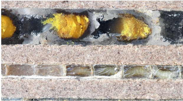
(Die Öffnungen der Brutröhren im Bild sind links.)

Die Brutröhren sehen bei den meisten Wildbienen in etwa so aus: